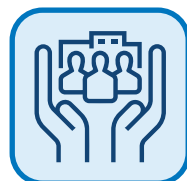
SERVIZI DI WELFARE AZIENDALE