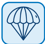
ASSOCIAZIONE ANTONIO PASTORE