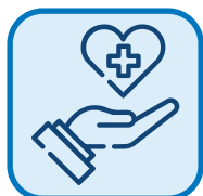
ASSISTENZA SANITARIA INTEGRATIVA